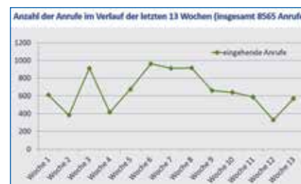
Abbildung 2: Anzahl der Anrufe bei der Telefon-Hotline im Verlauf der letzten 13 Wochen

Die Hotline wurde Mitte Juli wieder abgeschaltet, nachdem sich die Infektionssituation beruhigt hatte und die Hotline weniger in Anspruch genommen worden war (Abb. 2). Zudem hatten sich in einer Befragung 79 % der teilnehmenden 134 Professionellen dafür