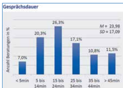
Abbildung 1: Durchschnittliche Dauer der Gespräche bei der Telefon-Hotline

Anrufe handelte es sich um einmalige Gespräche, in den meisten Fällen um kurze Kriseninterventionen und/oder Verweise/Beratung bzgl. Behandlungsmöglichkeiten. Themen waren u. a. coronaspezifische Ängste, depressive Reaktionen oder die Bewältigung der Quarantänesituation. Die überwiegen-